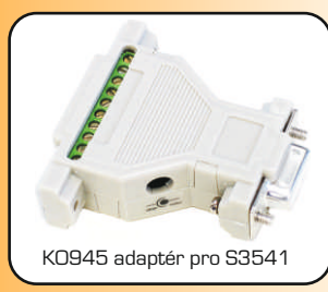
K0945 adaptér pro S3541