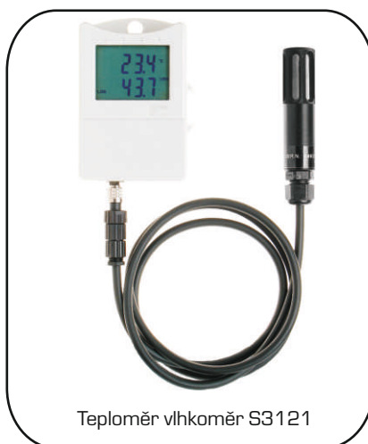
Teploměr vlhkoměr S3121