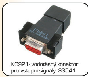
K0921- vodotěsný konektor pro vstupní signály S3541