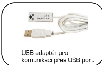
USB adaptér pro komunikaci přes USB port