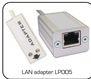
LAN adapter LP005