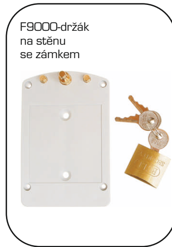
F9000-držák na stěnu se zámkem