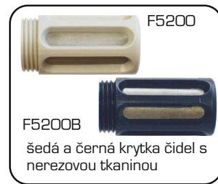
F5200 F5200B šedá a černá krytka čidel s nerezovou tkaninou